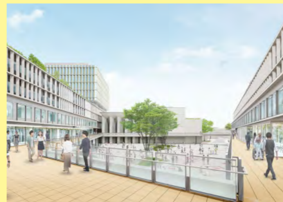
2階テラスから広場を眺める(イメージ図)