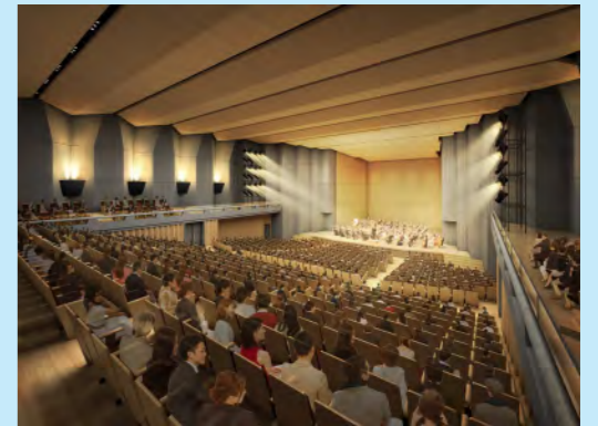
区民会館ホール(イメージ図)

区民交流スペースや広場、区民会館等の 様々な場所を使って、やってみたいこと をみんなで想像してみましょう！