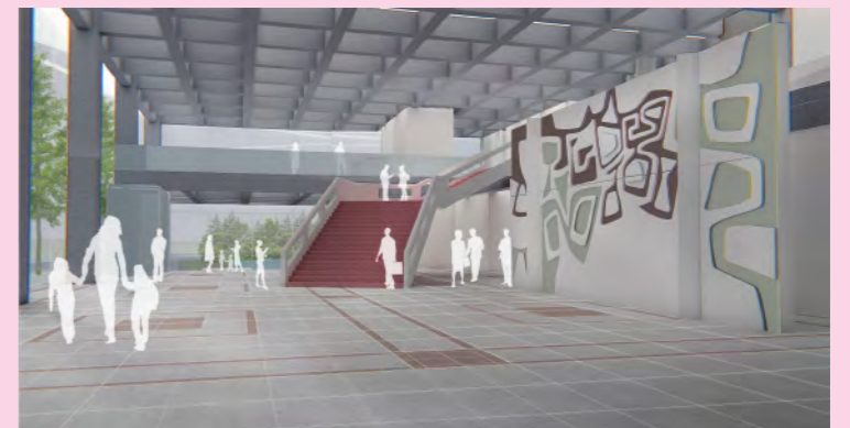
区民会館エントランスホール(イメージ図)

世田谷区にお住まいの方など、 みなさんが利用できる新施設。 どのような利用ルールが望ましい でしょうか。 この区民利用施設にぴったりの 仕組みを考えてみましょう。