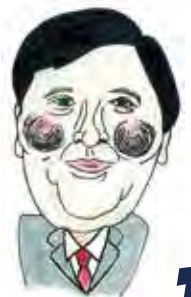
世田谷区長 保坂展人

でもそれには区民のみんなにも協力してもらわなきゃできないことがたくさんあるんだ。だからみんなにも未来の世田谷区をつくるための目標や考えを大きく9つに分けた“基本構想”を知ってもらいたいなあ or 知っておいてもらいたい。だって、これから20年間の約束事をまとめた、君たちに大きく関係する大切なものだから。