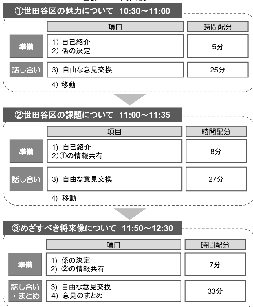
図表 I-2 午前の流れ

参加者は、始めに各グループで、「世田谷区の魅力」について話し合ったあと、テーブルを移動し、また別のグループの参加者と「世田谷区の課題」について話し合った。その後、初めのグループに戻り、お互いが他のテーブルで見聞きしてきた意見を共有しつつ、「めざすべき将来像」について話し合った。