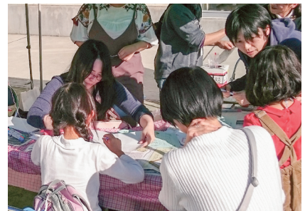
大山みちフェスティバル