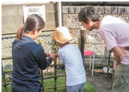
あきさみよ豪徳寺沖縄祭り