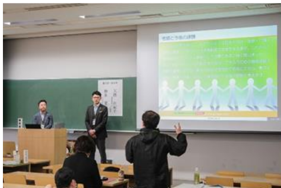
●せたがや区民福祉学会