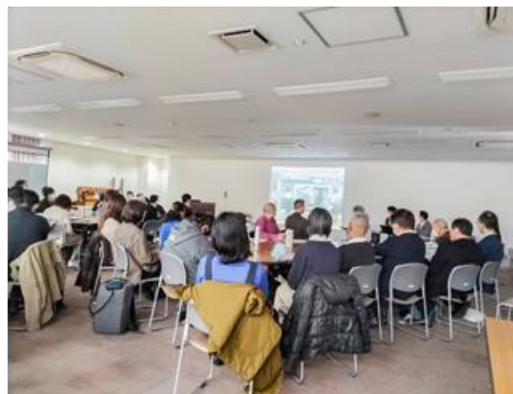
●烏山地域ケア会議