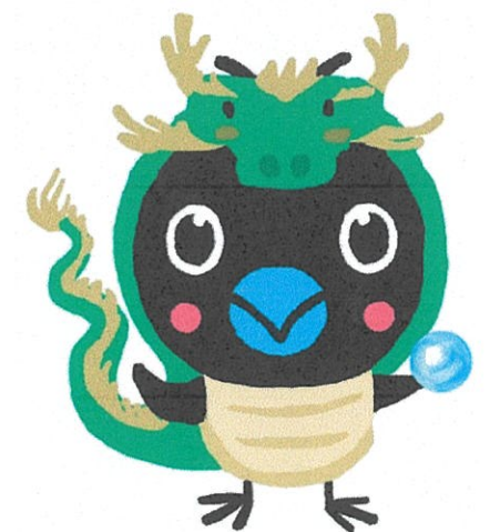
烏山地域キャラクターからびよん

募集人員は20組です。ご家族やご友人と一緒に参加することも可能です。もちろんお一人でも大歓迎!ご興味ある方は、烏山まちづくりセンターまたは烏山児童館にお問い合わせください。烏山まちづくりセンター 電話 03-3300-5420 (平日8:30～17:00) 烏山児童館 電話 03-3309-3003 (毎週月曜日と第2・4日曜日を除く 9:30～18:00)