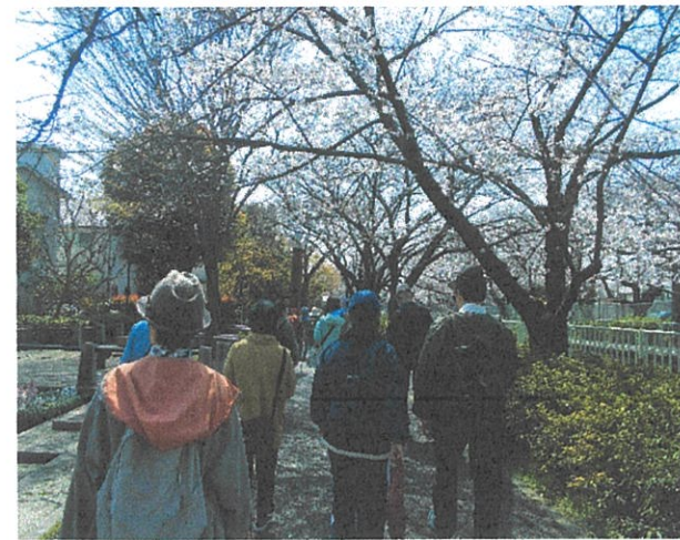
『咲き誇る桜を見ながら歩きます』

コース等の詳細は、町会・自治会回覧または区のお知らせ「せたがや」2月25日号でご確認ください