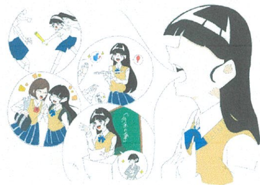
《イラスト作成・烏山中学校生徒》

渋谷教諭は「今年度烏山中学ではスピーチの出場者は授業の中で生徒達が自主的に推薦した生徒から決定し、学校紹介動画のビデオ撮影も生徒会が中心に行っています。選ばれた生徒も自分の考えを発表する機会をもらえて嬉しいと前向きです。地域の人々とのつながりができる事でこの地域も活性化し、学校の未来にもつなげていけたら。」と話されました。画面を通さず人と向き合う大切さが伝わりました。今年の中学生のつどいが楽しみです。