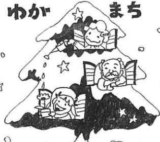
西経堂団地自治会

私達の団地は、入居以来25年になります。当時の壮年層は高齢者となり、世代の交替がすすんでいます。 65歳以上の世帯が20%に達し、一方乳幼児数は最盛時の5%に激減しています。 団地の生活様相が大きく変わってきており、自治会活動も深刻な問題をかかえるようになってまいりました。 老人問題、健康医療問題、