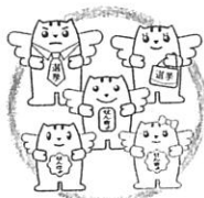
「選挙のめいすいくん」の家族

『幸せな明日のために この一票』 四月三日(日) 東京都知事選挙 四月二七日(日) 世田谷区長・世田谷区議会議員選挙 衆議院東京6区補欠選挙 皆さんの貴重な一票を投じましょう!