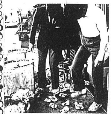
希望丘中ボランティア会

希望丘中学ボランティア ア会（生徒会の外郭団体 として位置づけ）が、現 役、OBを中心として一 九八九年十二月より学区 域に広く呼びかけて「ネ パール園タルパ村の学校 づくりのために」を目標 にアルミ缶を集め始めた。 生徒・OB・職員の粘り 強いとりくみで、毎月三 〜四百程が集められ、目 標額五〇万円に対して、