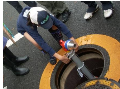
〈スタンドパイプを設置するところ〉

大規模災害のリスクが高まっています。7月5日(日)、災害時の対応能力の向上と、各人が生き延びる自覚を持つことを目的に、船橋会防災訓練が実施されました。3月に発行された“船橋会防災マップ”を使い、住民がそれぞれの“一時(いっとき)集合所”に集合。マップに掲載されている防災施設(スタンドパイプ・AED・防火水槽・震災時井戸水提供の家)をチェック。スタンプラリー形式で移動しながら最終集合所(池田児童遊園)に集合。防災講習会、スタンドパイプ・D級ポンプ放水訓練、水消火器による消火訓練、AED操作方法、アルファ米の炊き出し訓練などが行われました。参加人数は170名。幼児から70代の方までが一緒にまちを歩きました。「AEDがここにも置いてあった」「こんなところに消火器がある」等、住んでいながら気付かないことの多さにびっくり。災害時「このまちはどうなるのだろう」「自分ができることは何だろう」と皆の意識が高まります。防災訓練の意義はここにあるのです。一人でも多くの方が、町会や団体の訓練に参加していただきたいものです。