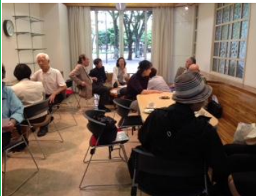
<常連さんも初参加の方も和やかに>

希望ヶ丘団地で産声をあげて早や4年。団地の自治会と管理事務所が協力して運営しています。主なスタッフは4人。お客さまは100円で手作りケーキとコーヒー又は紅茶で、心おきなくおしゃべりを楽しめます。トイレはちゃんと温便座になっています。高齢者の方々が、月に一度この喫茶店でお互いの元気を確かめあい、健やかに生活するコツを披露するところ。おいしい食の作り方、ステキなアクセサリーの作り方を教えあい、歌を歌ったり、時には人生相談も。他人様の邪魔をしない自由な会話で、心身をリフレッシュして前向きに生きる。悪くないでしょうか？どうぞいらしてください。お待ちしております。