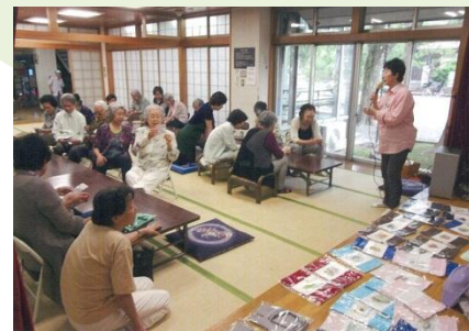
<6/16 10周年祝いのビンゴ大会の様子>

日 時：第1、第3火曜日 10:00~14:00 場 所：船橋地区会館 対 象：70歳以上 参加費：400円 予 約：参加者登録の必要あり 運営等：船橋地区民生児童委員及び OB、日赤奉仕団船橋分団、 社会福祉協議会