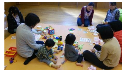
<見守られてゆったりと遊ぶ親子>

千歳台子育て「きらきらサロン」で毎回好評なのは紙芝居と手遊びです。紙芝居を始めると小さいお子さんもじっと見て聞いています。遊び道具も充実していて大きなお部屋にマットを敷き、丸いプールに大小のボールをたくさん入れてその中で遊んだり、長いトンネルもありその中をハイハイで通ったりと、家ではなかなか出来ない遊びが人気です。もう一つ、「先輩お母さんに悩みを聞いてもらうことでホッとすることもあります。」と参加者からの声。「お茶を飲みながら、みんなで楽しくおしゃべりしませんか？」との趣旨でママ同士の交流も盛んなきらきらサロン。少人数でアットホームな開催をしています。お気軽にご参加ください。