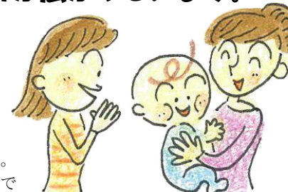
イラスト/鈴木れい子

★今回は紙面の都合で5ヶ所を掲載しました。 お問い合わせは船橋まちづくりセンターまで