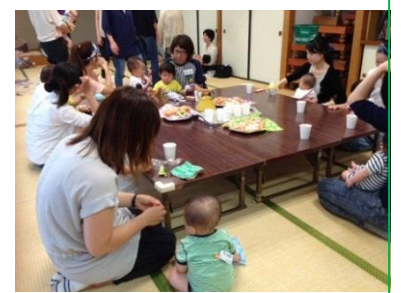
<畳の上で赤ちゃんも安心>

日 時：第1木曜日、第3水曜日 10:00~12:00 場 所：船橋地区会館1階の畳の大広間 対 象：0歳からおおむね1歳未満の お子さんとママ(パパ) 参加費：100円 予 約：必要なし 運営等：船橋地区民生児童委員、 主任児童委員、社会福祉協議会