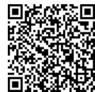
東京都陽性者登録センター