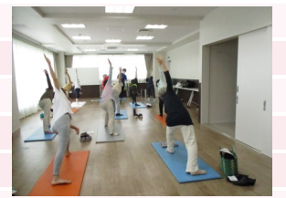
ヨガでしなやかに身体改善