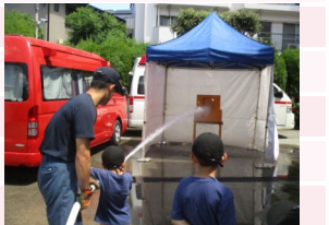
親子で学ぶ！防災教室