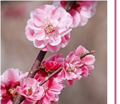
開花した「楠玉」(イメージ)

今年の1月25日に45周年を記念した植樹式が執り行われ、羽根木公園の梅林に「楠玉（くすだま）」が植樹されました。