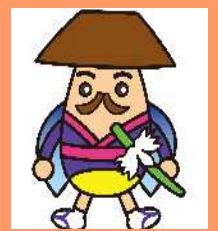
上町地区キャラクター「代官ホタルン」

歳末たすけあい 地域支えあい募金 皆様のご協力をよろしくお願いたします 12月11日(月)まで 日赤上町分団 上町地区社会福祉協議会