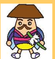
上町地区キャラクター 「代官ホタルン」

平成29年4月1日 上町地区身近なまちづくり 推進協議会 文化部会 上町まちづくりセンター 電話 (3420) 4241 FAX (5477) 7920