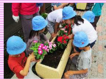
[桜小学校/花の小径]