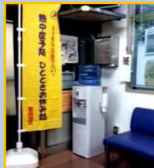
休憩コーナーとウォーターサーバーがあります。(一部除く)