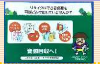
啓発用ポケットティッシュ