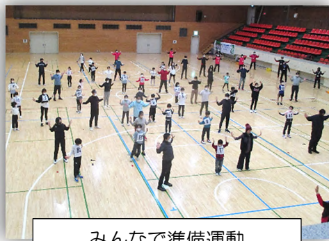
みんなで準備運動