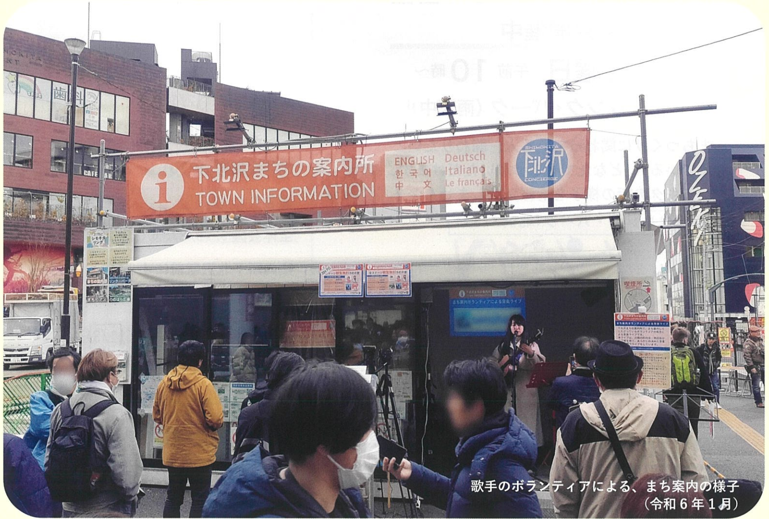
歌手のボランティアによる、まち案内の様子 (令和6年1月)