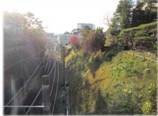
その他の公共施設の例