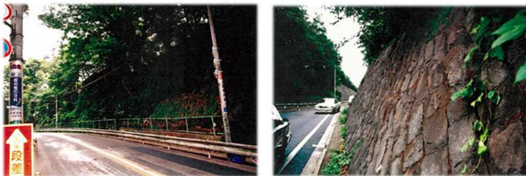
道路防災総点検箇所の例

通称「道路防災カルテ」と呼ばれ、主要な区道に面するがけや擁壁について豪雨や地震に対する安全性を点検し、その点検結果をデータベース化すること及び個々の点検箇所について道路管理者が日常の管理業務等に活用を図るもの。