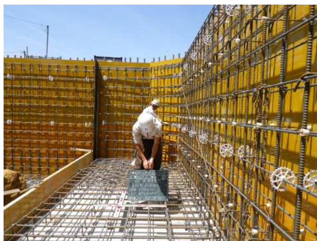
開発行為に伴う擁壁築造現場の配筋検査