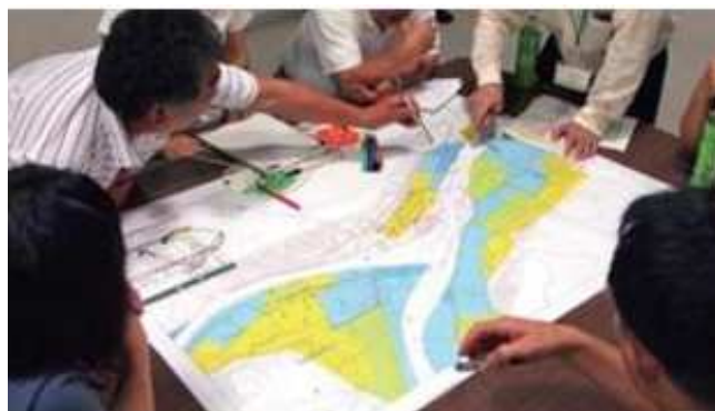
ハザードマップを使用した避難訓練の様子