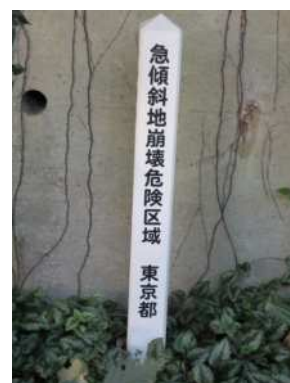
急傾斜地崩壊危険区域の例