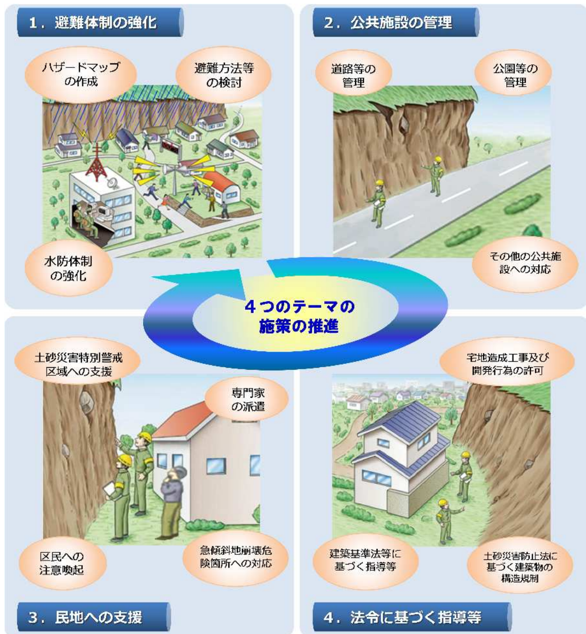
防災対策方針のイメージ

第6章では、これまでの取り組みと合わせて「土砂災害防止法」による区域指定などの新たな課題にも対応するための施策を「1. 避難体制の強化」、「2. 公共施設の管理」、「3. 民地への支援」、「4. 法令に基づく指導等」の4つのテーマごとに「防災対策方針」としてとりまとめます。