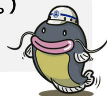
防災キャラクター「じじよすけ」