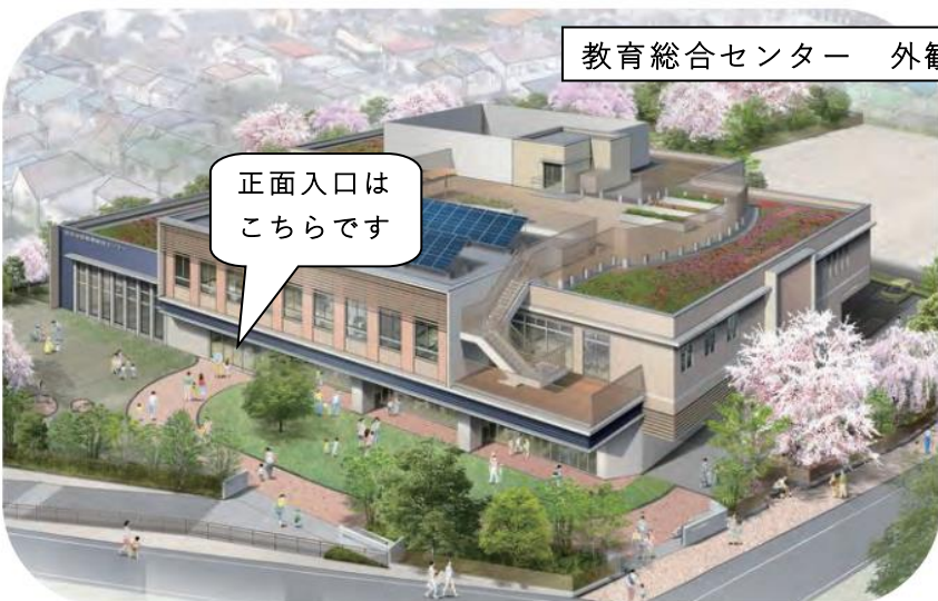
教育総合センター 外観