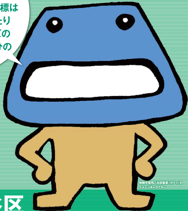
体験学習用ごみ収集車「カティ」のイメージキャラクター