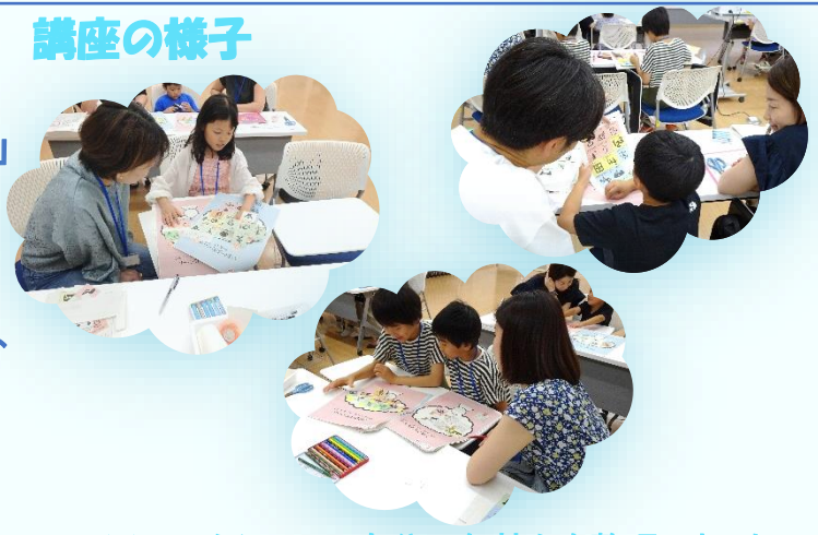
※ワークシートで自分の気持ちを整理しました。