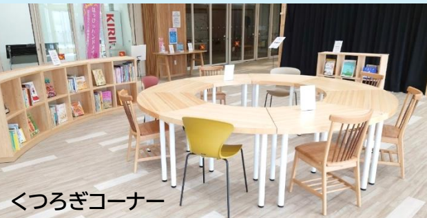
くつろぎコーナー