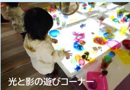
光と影の遊びコーナー

お絵かきや工作、水遊びにどろ遊び、光や色の変化を体験できるのも、この施設の魅力です！