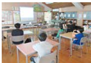
ほっとスクールの様子