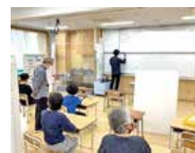
〈自閉症・情緒障害特別支援学級〉の朝の様子