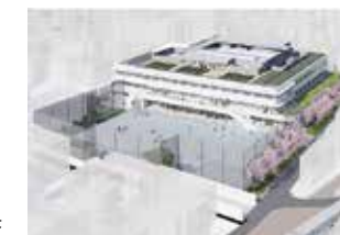
池之上小学校改築イメージ