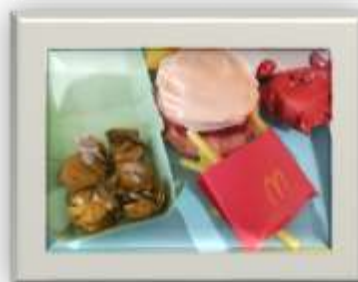
『ハンバーガーのセット』