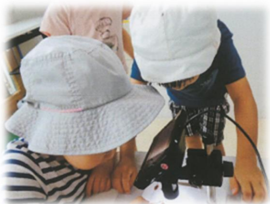
もっとよく見てみよう