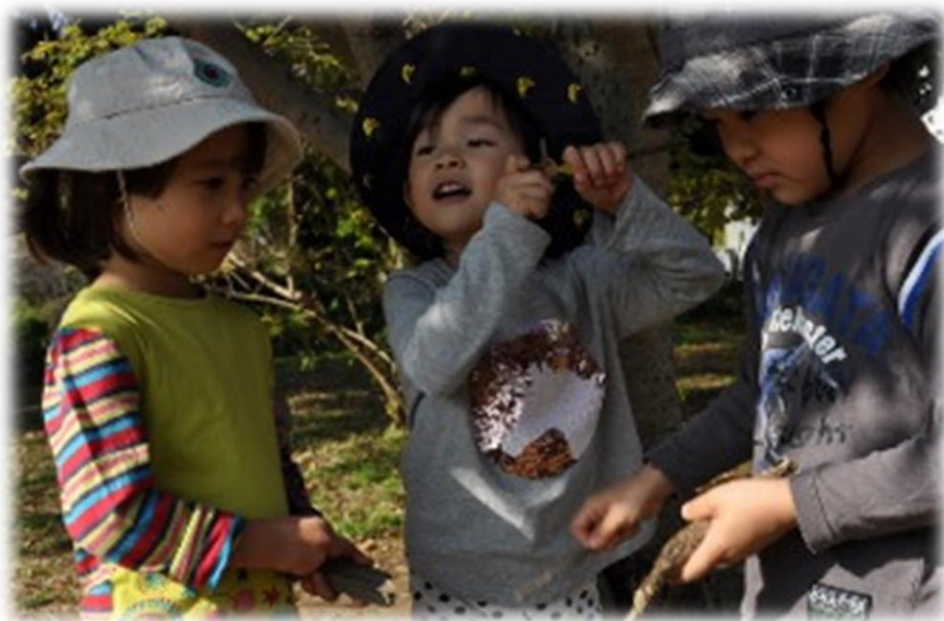
身近な環境に関わる、感じる、考える