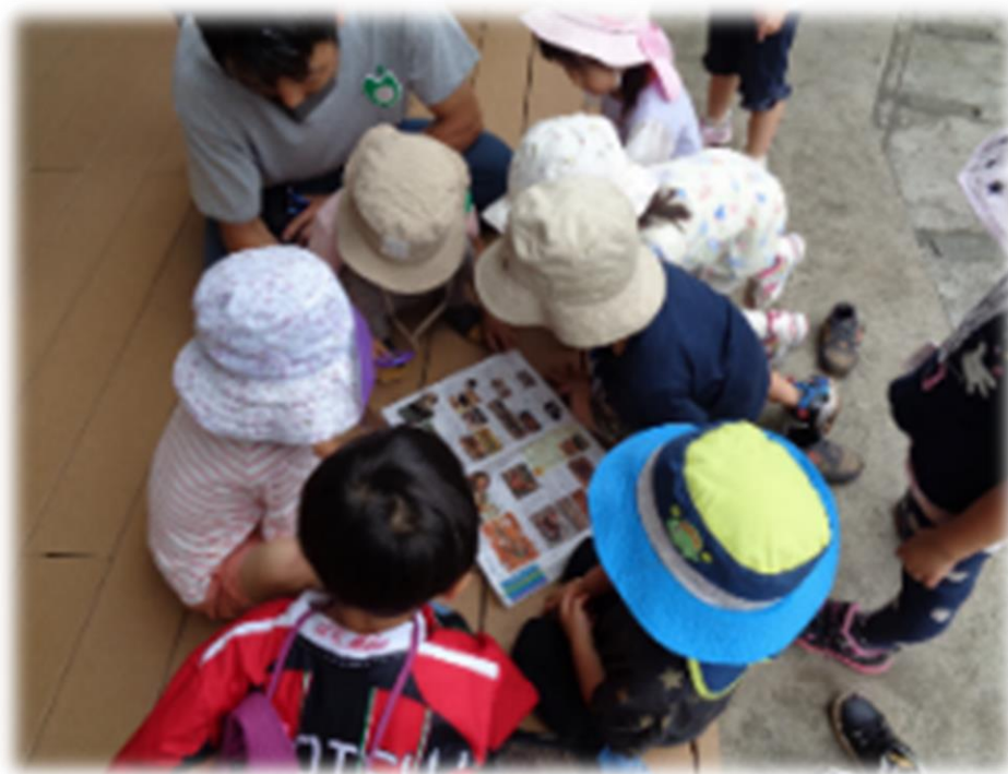
「この虫、なんだろう」一緒に調べて、みんなで相談