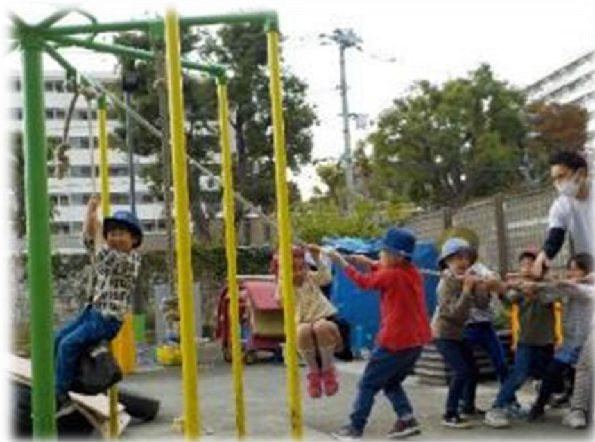
見守ったり、一緒に考えたり、遊んだり