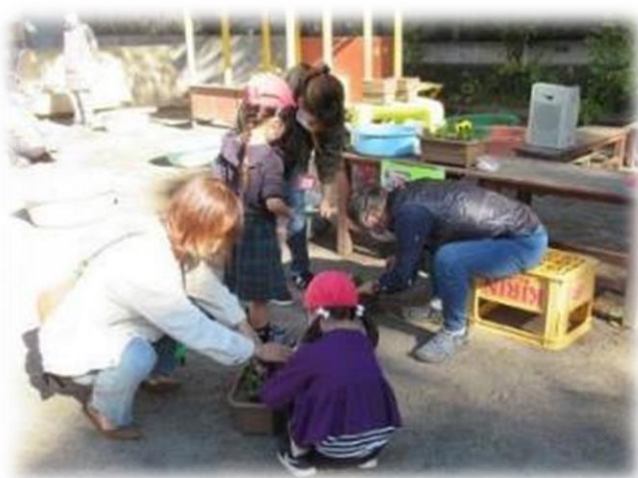
近隣のボランティアの方と、園庭で苗を植える