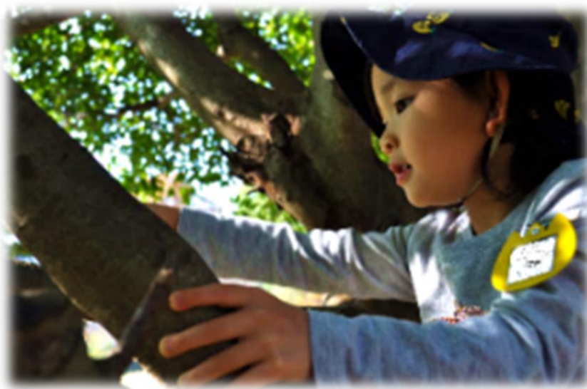
心地よく自然を感じる