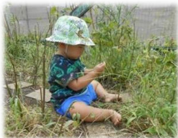
「いいもの、みつけた」