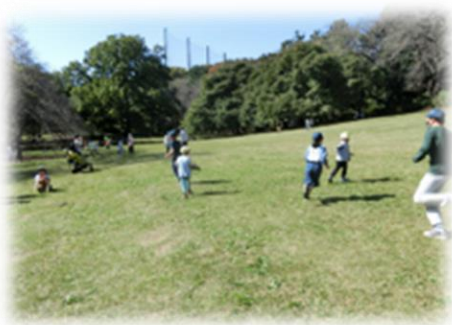
交流活動を通じて、互いを身近に感じる