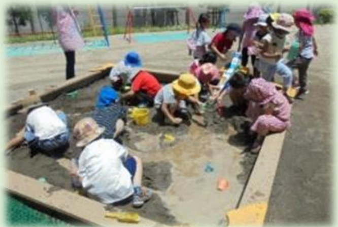
イメージを共有、夢中になって遊び込む