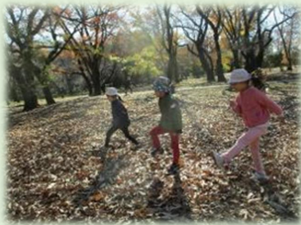
こもれびの下、落ち葉の上を一緒に歩く

保育を始めるにあたっては、親子の関係を踏まえて、それぞれの親子と私たちがどういう関係を築いて園生活を過ごしていくのがよいかを考えています。中でも、愛着の関係を築いていくというのは、育みたい資質・能力の中でも、特に「学びに向かう人間性」の基礎にあたると考えています。ですから、入園前の成育歴、家庭環境、発達の様子を理解し把握に努めています。子どもにとっての入園は、慣れた生活の流れやそれまで親しんできた大人との信頼関係、友達関係が新しい環境に変わるため、馴染むのに時間がかかる場合もあります。子どもが入園するという事は、保護者にとっても環境が大きく変わる事柄ですし、子育てに自信がもてていなかったり、不安を抱えていたりする場合があります。家庭の様子や保護者の思いを共有し、安心して園に通ってもらう中で信頼関係を築き、園と保護者が連携して子どもの育ちを支えることを大切にしています。また、地域全体で子育てを支える視点をもって、子育てステーションや様々な集いの場とも協力しながら取り組んでいくことが重要だと感じています。