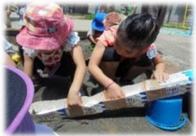
「水が流れていくところに、池を作ろうか」