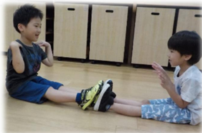
リズムを合わせる、息を合わせる