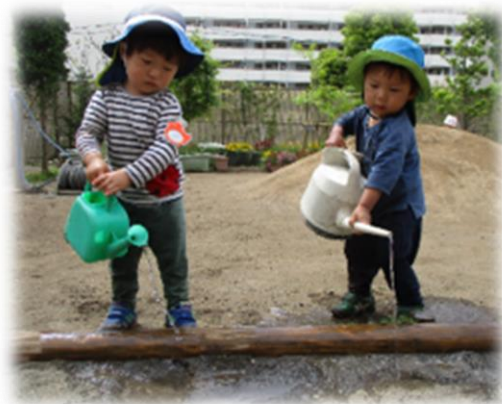
水をここに入れるの、楽しい