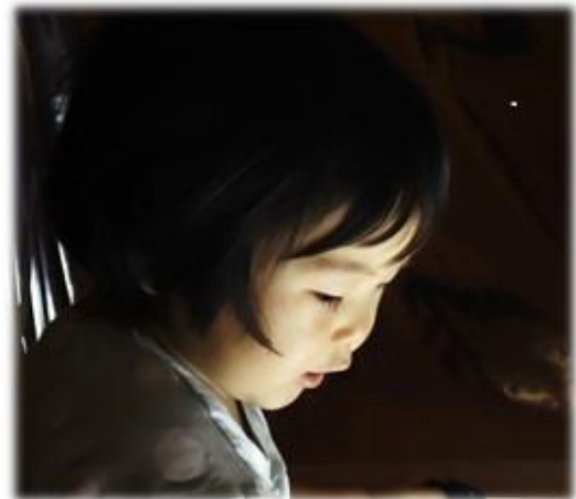
内なる声に耳を傾ける