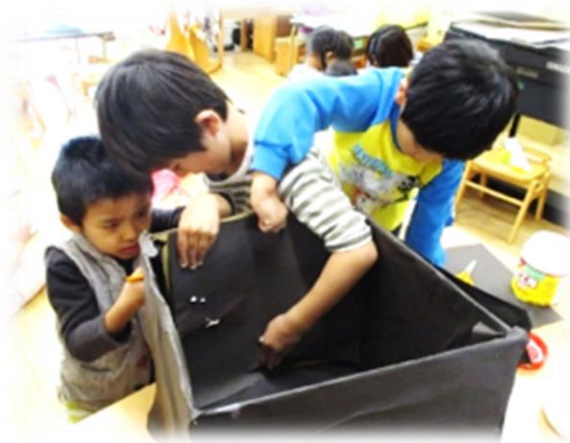
一緒に考えた劇の道具が、もうすぐ完成