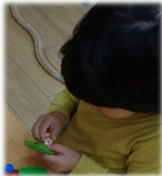
ボタンはめ、自分でやりたい

● 身近な人の言葉を理解し、絵本などを楽しむことを通じ、自分から言葉を使おうとし、やり取りや挨拶などを楽しむ。