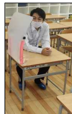
透明パーテーション (イメージ)