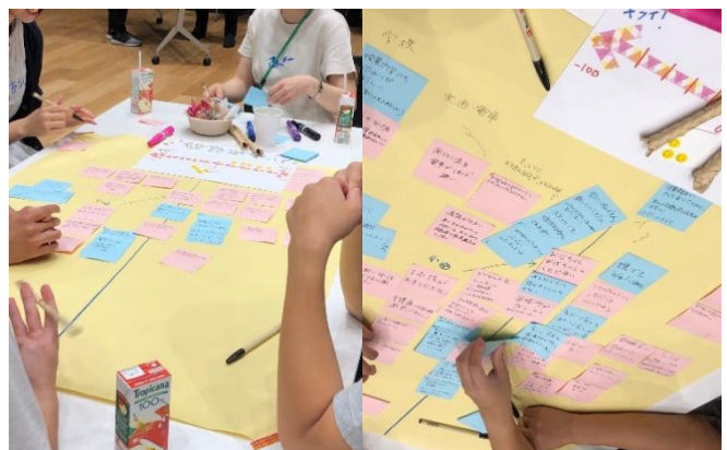
《ワークショップの様子》

世田谷がこうなったら良い「願い・想い」に対して、どうすれば良いか・どうなって欲しいかという話では「居場所」「情報」が特に多く、次いで「学校」が挙げられた。「居場所」では、「集まれる場所があれば小さくても良い」、「高校生同士で話していても、騒がしいと言われない場所。ただしゃべっているだけで迷惑と言われていると辛い」、「自習できる＋おしゃべりができる場所。塾の自習室だと私語厳禁で友人と教え合いながら勉強することができない。おしゃべりしながら勉強できる場所がほしい」という意見があった。情報では「情報は普段は周りの大人（児童館職員など）から聞く。知りたいと思って調べたり、意識したりしないと知ることができないので、もっと日常の中で知ることができたらいい」、「（紙媒体の通信など）配っても見ない人はいるから、学校の授業（社会科見学）として、施設に行くのがいいと思う」、「居場所のまとめサイトを作れば、そこで知って色々なところへ行くきっかけになるかもしれない」という意見があった。その他では「大人向けの健康器具が多いのが悪いと思っている訳ではない。子どもに対する禁止が多い。私たちの遊びたいきもちを理解して欲しい」、「まず学校の先生など、子どもにとって身近な大人が子どもの居場所を理解することが大切だと思う。だから社会科見学とかで、施設に来て欲しい」、「地域のつながりを強くするために、いろいろなボランティアを頻繁にできる環境をつくる。限られた人しか取り組んでいないのが現状。もっとみんなが関わったら、経験になる。いろいろな技の習得にもつながる。（例えば、PA 機材