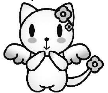
マスコットキャラクター なちゅ

<お問い合わせ> 子ども・若者部 子ども・若者支援課 セたホッと事務局 TEL / 03-3439-8415 FAX / 03-3439-6777