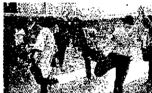
相手を信じて押し合います

その後のペアーヨガは2人で行います。社会教育主事の先生、副校長先生もご参加されとても盛り上がりました。お互いの力を信じて頼ることで成立する動きは生活の中の場面でも生かせるのではとのお話でした。