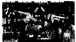
生徒さんのお二人がお手本さす中です

ヨガというのは牛のくびき、「つながり」という意味なのだそうです。ヨガを始めた海外でのきっかけや帰国後の「つながり」に満ちた経緯、またヨガの考え方は体だけでなく、生活にも生かす事ができる、とのお話でした。ヨガは瞑想の為に体を整え、呼吸をつなげるように行うものだそうです。