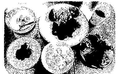
とってもおいしい料理ができました!