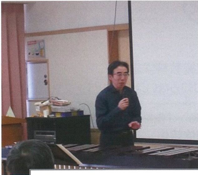
楽しいお話を交えての演奏でした♪