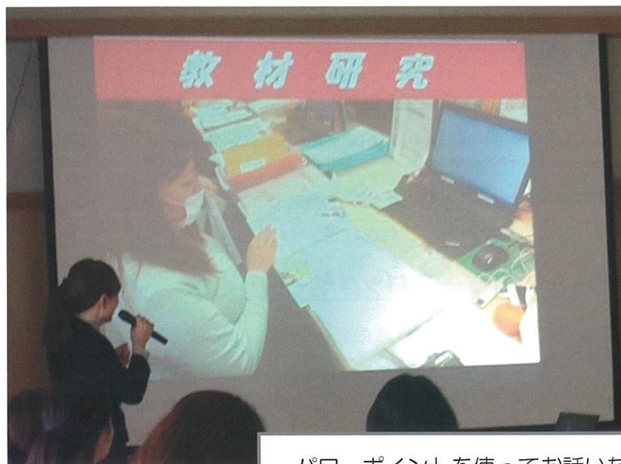
パワーポイントを使ってお話いただきました