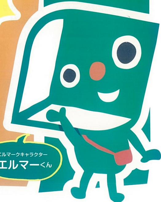
エルマークキャラクター エルマーくん