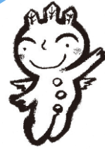
十日町市PRキャラクター 「ネージュ」