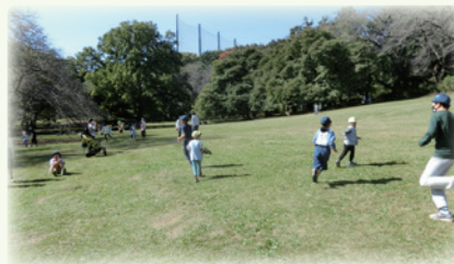
交流活動を通じて、互いを身近に感じる