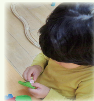
ボタンはめ、自分でやりたい