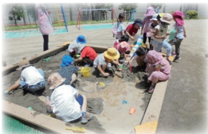
イメージを共有、夢中になって遊び込む