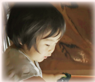
内なる声に耳を傾ける