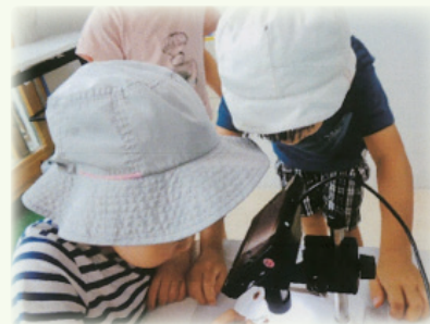
もっとよく見てみよう