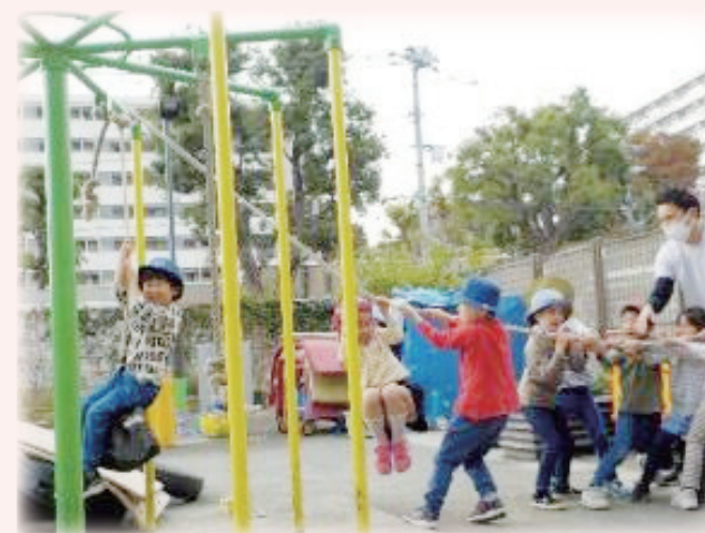
見守ったり、一緒に考えたり、遊んだり