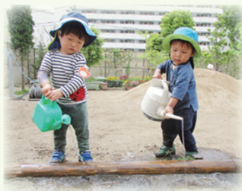
水をここに入れるの、楽しい