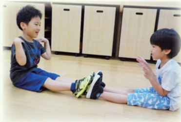
リズムを合わせる、息を合わせる