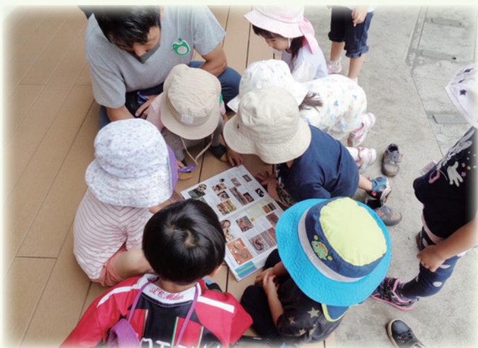
「この虫、なんだろう」一緒に調べて、みんなで相談