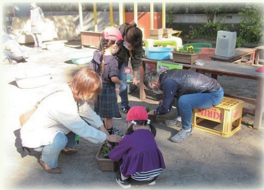
近隣のボランティアの方と、園庭で苗を植える