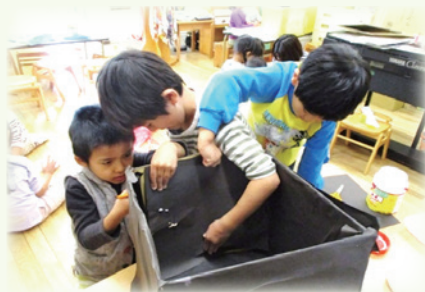
一緒に考えた劇の道具が、もうすぐ完成