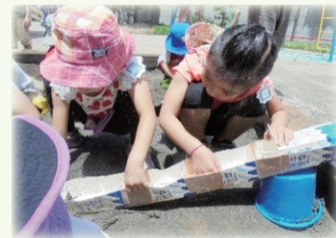
「水が流れていくところに、池を作ろうか」