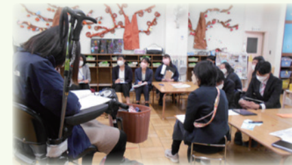
保育者と小学校の教員が一緒の場面を見ながら、子どもの理解を深める