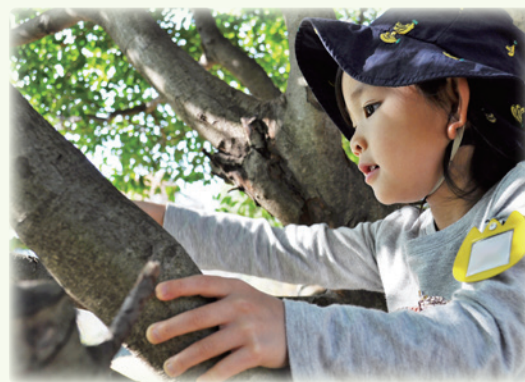
心地よく自然を感じる