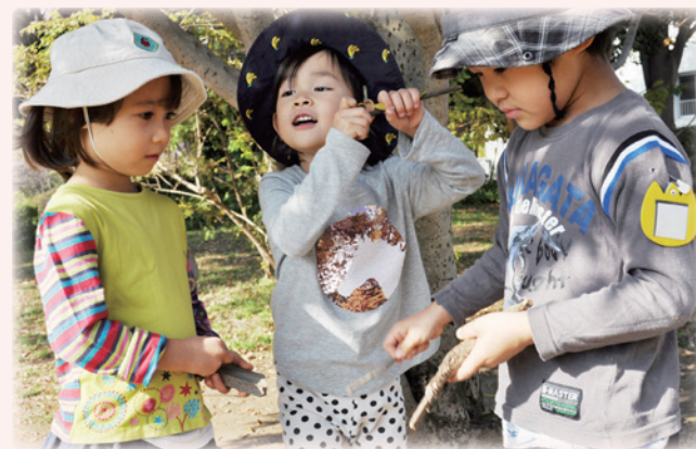
身近な環境に関わる、感じる、考える