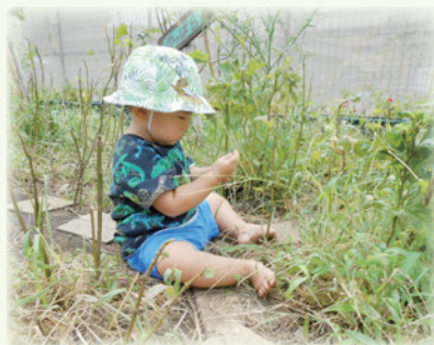
「いいもの、みつけた」