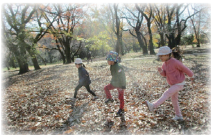
こもれびの下、落ち葉の上を一緒に歩く

保育を始めるにあたっては、親子の関係を踏まえて、それぞれの親子と私たちがどういう関係を築いて園生活を過ごしていくのがよいかを考えています。中でも、愛着の関係を築いていくというのは、育みたい資質・能力の中でも、特に「学びに向かう人間性」の基礎にあたると考えています。ですから、入園前の成育歴、家庭環境、発達の様子を理解し把握に努めています。子どもにとっての入園は、慣れた生活の流れやそれまで親しんできた大人との信頼関係、友達関係が新しい環境に変わるため、馴染むのに時間がかかる場合もあります。子どもが入園するということは、保護者にとっても環境が大きく変わる事柄ですし、子育てに自信がもていなかったり、不安を抱えていたりする場合もあります。家庭の様子や保護者の思いを共有し、安心して園に通ってもらう中で信頼関係を築き、園と保護者が連携して子どもの育ちを支えることを大切にしています。また、地域全体で子育てを支える視点をもって、子育てステーションや様々な集いの場とも協力しながら取り組んでいくことが重要だと感じています。