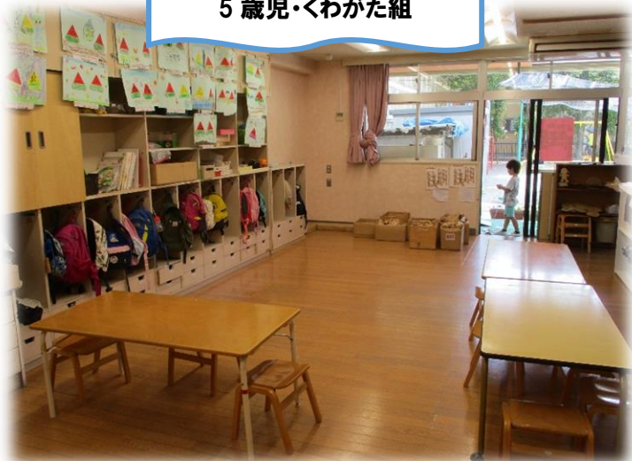
5 歳児・くわがた組