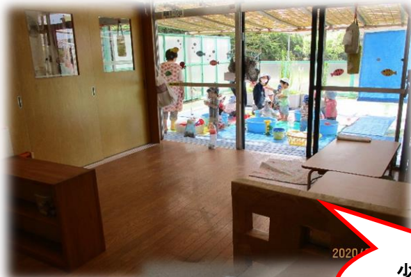
少人数に分かれ 過ごしています。