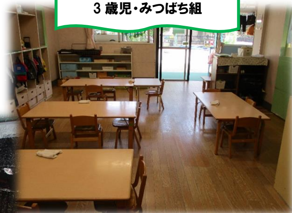
3 歳児・みつばち組