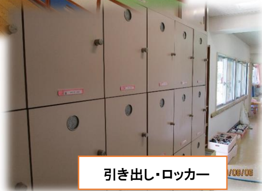
引き出し・ロッカー