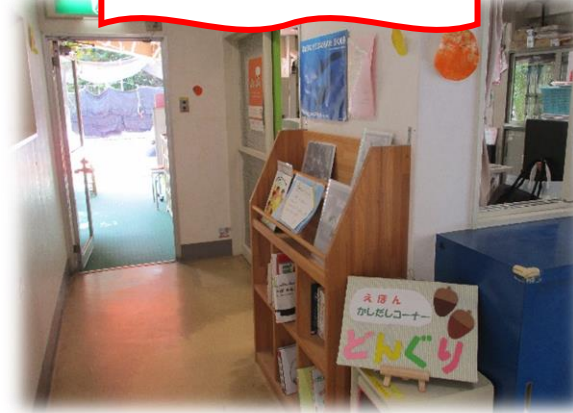
貸出絵本コーナー