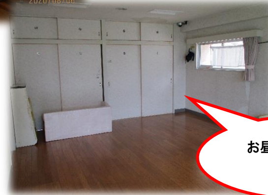
お昼寝はこの部屋を 使います。