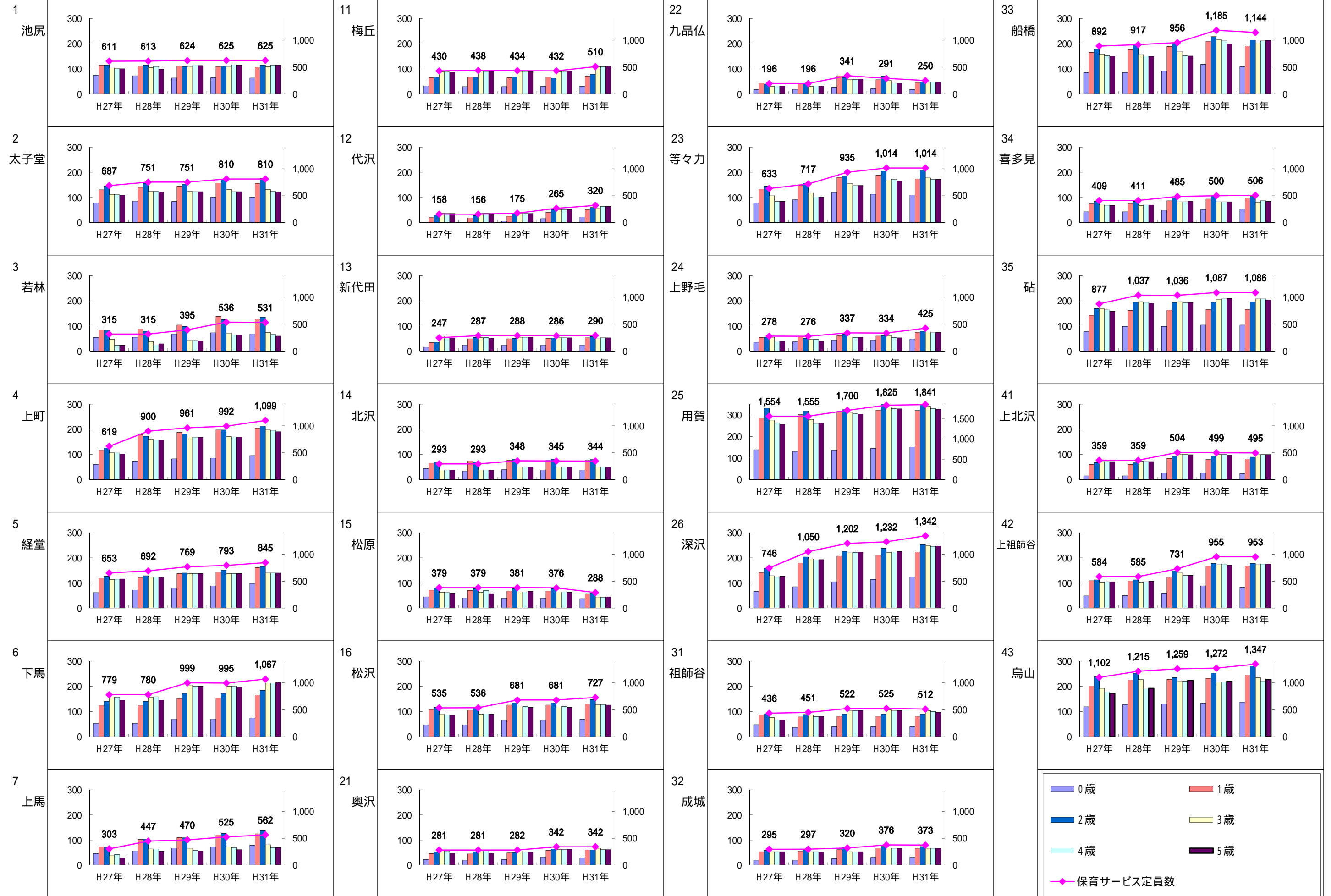
グラフ3-3 地区別の保育事業量の状況（各年4月1日）

棒グラフは年齢別定員数（人）で左軸に対応。折線グラフは保育サービス総定員数で右軸に対応。