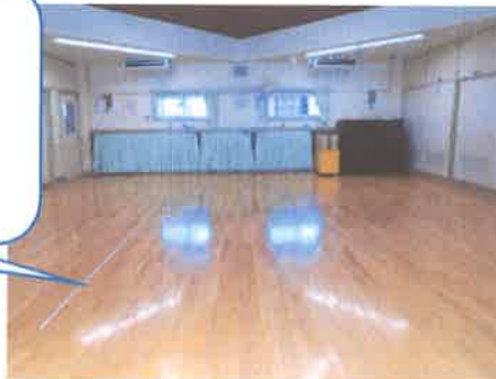
2歳児室～ちゅうりっぷ組～

＜ホール＞ 行事の集会や誕生会を行って います。普段はピアノのリズムに合 わせて身体を動かしたり、体操等も したりしています。 2～4歳児の午睡は、ここで しています。