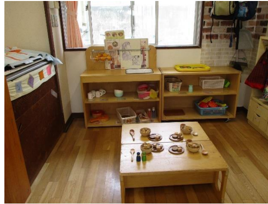
ままごとコーナー