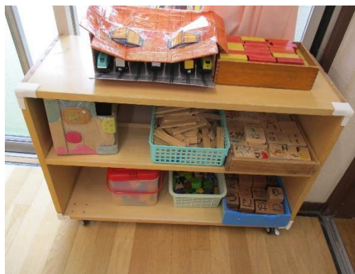
積み木 ブロックコーナー