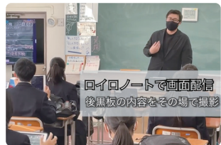
「ロイロノートの活用」 上祖師谷中学校