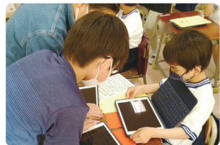
「駒繫小パソコン先生」 駒繫小学校