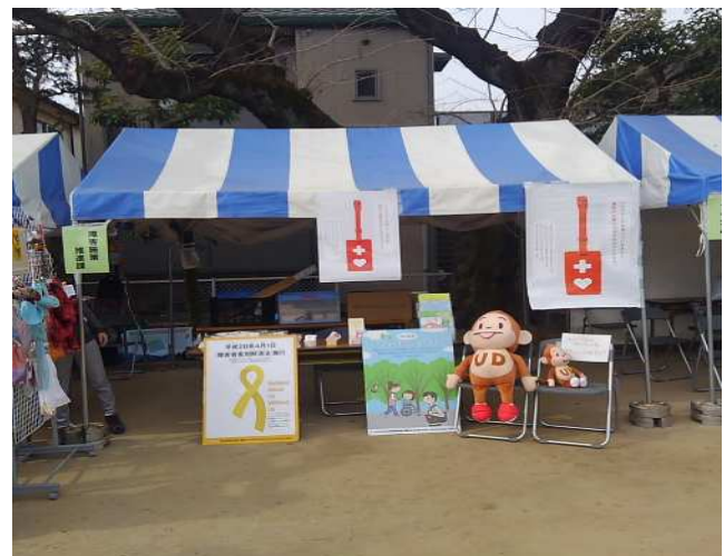
左：ヘルプマーク配布箱セット 右上：玉川高島屋 SC での周知 右下：羽根木公園梅まつりでの周知