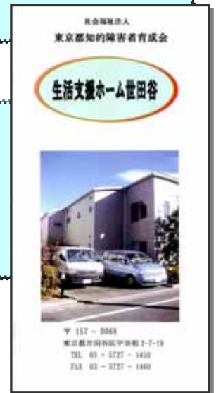
施設パンフレット