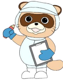
はさPOM 世田谷区HACCP推進キャラクター