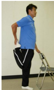
太ももの前を伸ばす