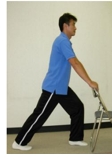
ふくらはぎ・ひざ裏伸ばし