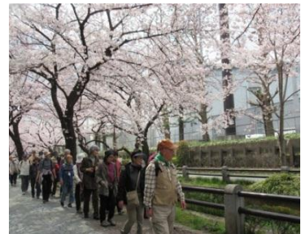
[たませみウォークの様子]