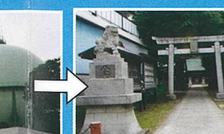
稲荷神社 (廻沢神社) この地域はかつて廻沢という地名で、この神社や廻沢通り、バス停に昔の地名が偲べれます。