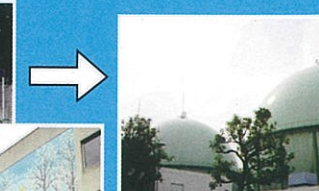
粕谷のガスタンク / 世田谷百景入口近くにめずらしいガス灯があります。