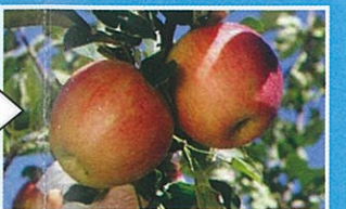
環八を渡り、千歳台に入ると、畑や果樹園があります。