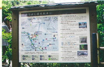
ふなばし歴史散歩の看板 / 能勢公園