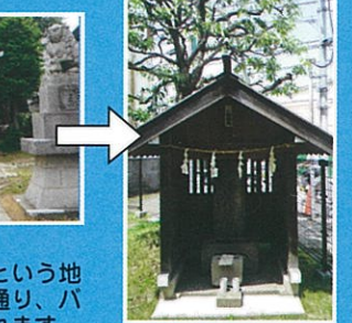
塚戸十字路にある庚申塔