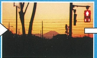
環八の富士山ビューポイントから見た夕日の富士山。