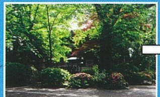
宝性寺 真言宗のお寺。玉川八十八ヶ所霊場 43番。