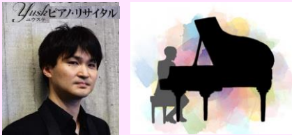
トゥレット友の会

●舞台パフォーマンス (14:00~16:25) 詳細は裏面 チック症を克服した Yusk氏 (英国王立音楽院非常勤講師) ピアノ演奏、楽しい脳トレ教室、小噺と落語、紙芝居、サルサダンス、インド舞踊、フラダンス、社交ダンス