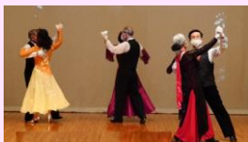
中高年社交ダンスサークル