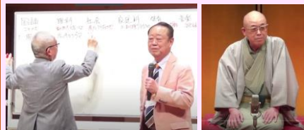
脳トレ教室 元気にハイ! [ご当地]家族会