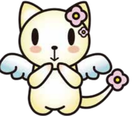
マスコットキャラクター なちゅ

世界をみれば、1日1.25ドルで暮らす「極度の貧困」にある人々は12億人にのぼり、その1/3が、13歳未満の子どもです。(世界銀行のレポート 2013年度)。