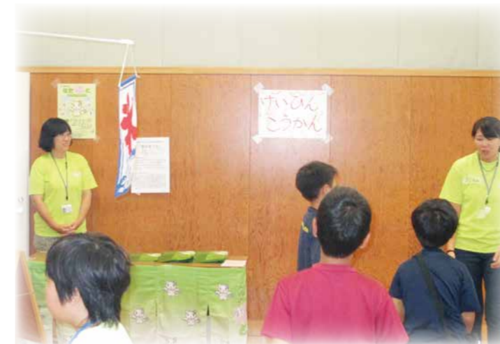
等々力児童館ミニえんにち(8月)