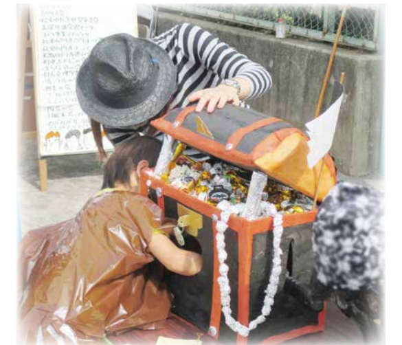
松沢児童館あそびの宝島(10月)