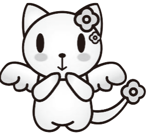
マスコットキャラクター なちゅ

7月18日(土)に、北沢タウンホールで26年度の活動を報告しました。新規相談件数は219件、25年度からの継続相談を合わせると252件の相談があり、187件が終了しました。委員と専門員の総活動回数は1,726回です。また、「せたホット」が出した「通常学級での特別支援教育についての意見」について説明しました。「なちゅ」のカードを見てかけてくる子どもからの相談が全体の6割にもなり、「せたホット」に相談してくる子どもが増えていることはうれしいことです。