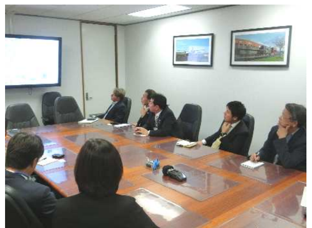
事業担当者のアシュレイさんから説明を受ける様子

ドルフィン・ディスカバリー・センターは、今でも世界中から多くの観光客やボランティアが集う施設ですが、再整備にあたり200人以上のボランティアの