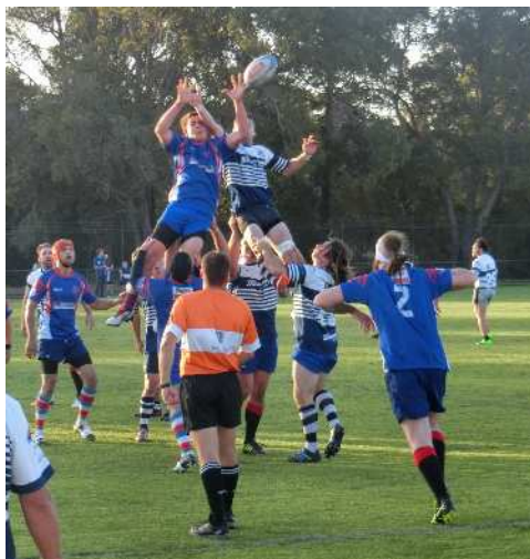
ラインアウトでの激しい攻防