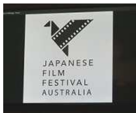
映画祭をPRするロゴ

日本映画祭は、キャンベラ、アデレード、シドニー、パースといったオーストラリア各地を巡回して開催されているシドニー国際交流基金が主催するイベントで、バンバリーでは、市で一番歴史あるローズホテルで開催されました。