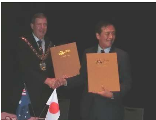
ブレナン市長と保坂区長