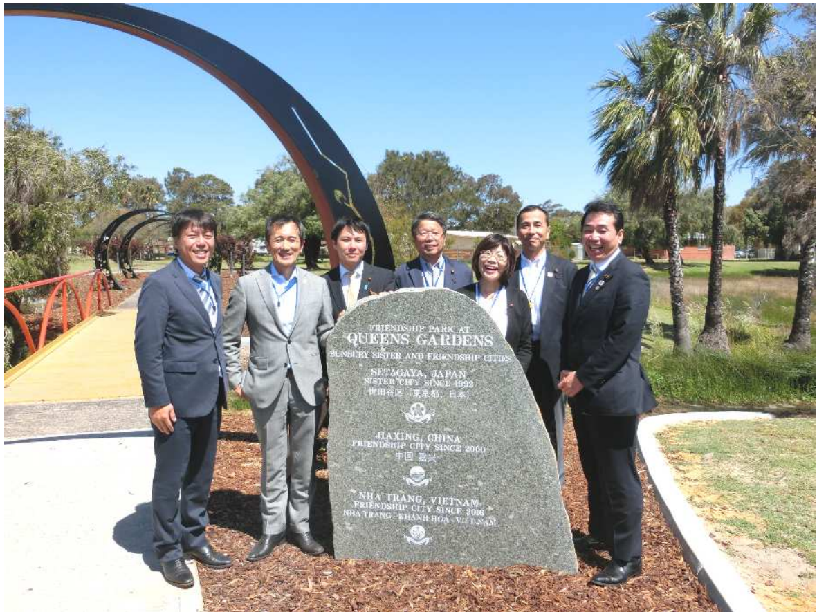
友好公園の記念碑にて。議長とともに