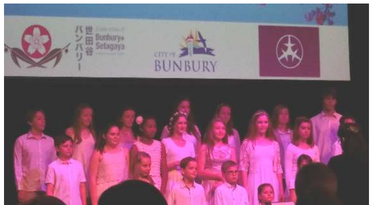
おもてなしの合唱