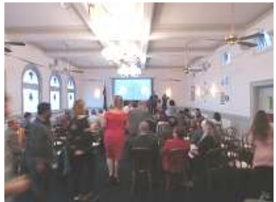
映画祭会場の様子

映画は万国共通の余暇であるとともに、日本の文化に造詣が深い方々が多く出席されていたと感じました。終了後には、来場者から訪問団に作品内容についての質問があり、来場者の日本文化への関心の高さが改めて感じられました。