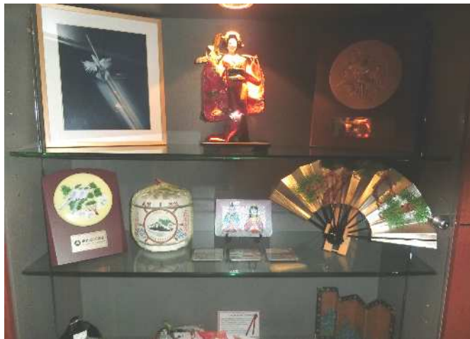
議事堂内の展示コーナー

くださいました。その後、市議会主催の夕食会にお招きいただきました。昨日の市長主催の夕食会よりも、さらにリラックスした雰囲気の中で、バンバリー市議会議員の皆さんと、交流関係の末永い継続と発展に向け、夢を語り合いました。