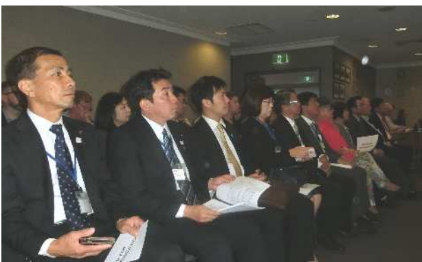
市議会を傍聴する訪問団

バンバリー市議会では市長が議長役を務めます。会議では、まず、議員の中から選ばれる副市長を選出し、所属委員会の割り振りなどの議事後、道路開発に関する計画案の審議が行われました。計画案に対し議員から修正案が提案され、さらに賛成派、反対派それぞれの市民代表が意見を述べた後、議員が意見を述べ、採決となりました。世田谷区議会の進め方やスタイルとは、大きく違いますが、興味深く傍聴させていただきました。