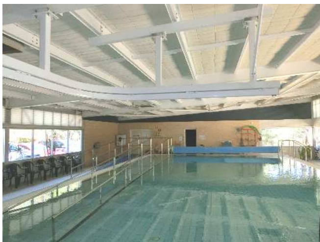
広々とした屋内プール

学校は、広大な自然の中に立地し、とてもリラックスできる環境にあります。芝生の中庭では、身体を使って思いきり遊べるスペースがあり、先生は一步下がって子どもたちを見守っていました。そして、この広大な敷地のより多くの場所を生徒のために使いたいとの校長先生の言葉に子どもたちへの深い愛情を感じ、大変印象に残りました。