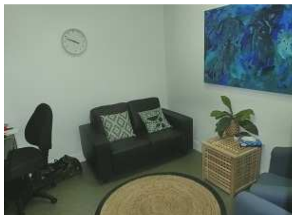
ミーティングスペース

オーストラリアでも生き辛さを抱える若者が増えているようで、特に、自殺者の増加が深刻な社会問題になっています。課題解決のためにはヘッド・スペースだけの取り組みでは難しく、家族、学校、地域など社会全体で支援する体制の構築に向け取り組んでいるそうです。具体的には、フィットネスクラブに働きかけ、若者が参加できるような場を共同で企画したり、学校と連携し美術教室や講話会を設けるなどなど。また、施設でイベントを開催して近隣の方をお招きするなど、ヘッド・スペースの活動を地域の方に知っていただくための取り組みにも力を入れているそうです。