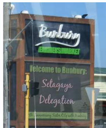
マーケットの看板

今回の訪問では、このファーマーズマーケットだけでなく、町のいたる所に親善訪問を歓迎する電光表示やフラッグが掲げられており、町全体でおもてなしをしようという気持ちが強く伝わってきました。この町ぐるみの歓迎の取り組みは、バンバリーを初めとした姉妹都市の方々がいらっしゃった際には、是非、世田谷でも実施すべきではないかと、気づかされました。