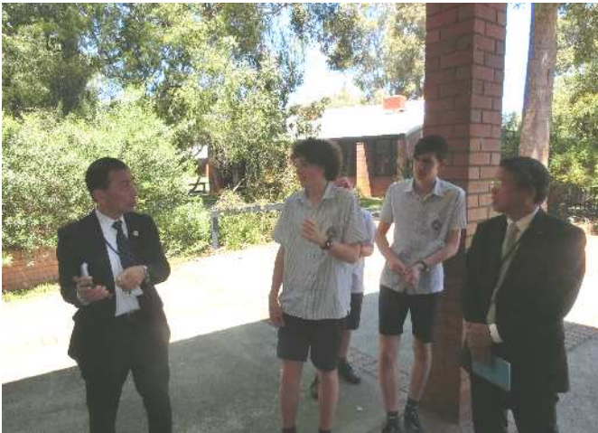
生徒たちによる案内