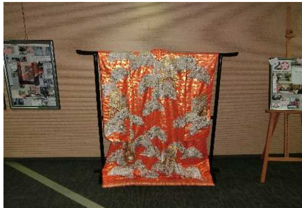
会場には、交流のあゆみなども紹介されていました