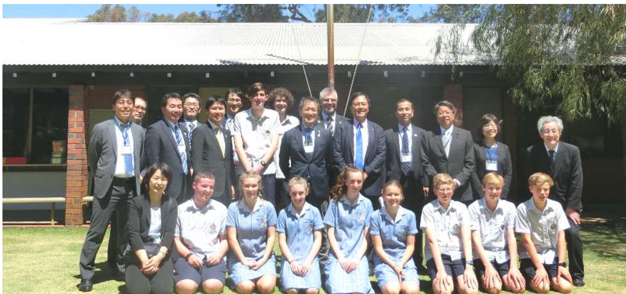
生徒・先生方とともに

するとともに、課題の共有や新たな提案をいただくことが出来、大変有意義な意見交換の場となりました。生徒たちや先生方を初め、全校を挙げての真心のこもったおもてなしをいただき、感謝の想いを胸に、私たちは次の訪問先へ向かいました。