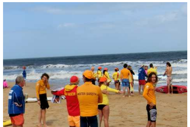
トレーニングの様子