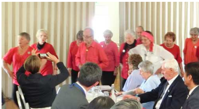
ダンスを披露していただいた後 一緒に踊りました

ちなみに、この建物は1877年に個人の方のお宅として建設されたもので、その後産婦人科の病院に改修され現在に至っているとのこと。私たちが訪問した日も、当時の病院で生まれた方もいらっしゃっており、時代時代で姿を変えながら、バンバリーの人々の暮らしを支えてきた施設の歴史を感じながら、利用者の方々とランチを楽しみました。