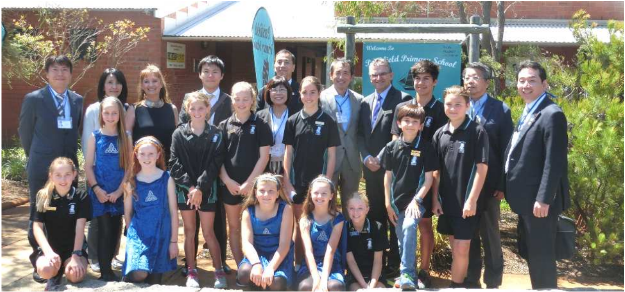
案内していただいた生徒・先生方と