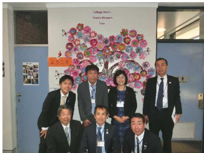
生徒が作ってくれた歓迎の“桜の木”