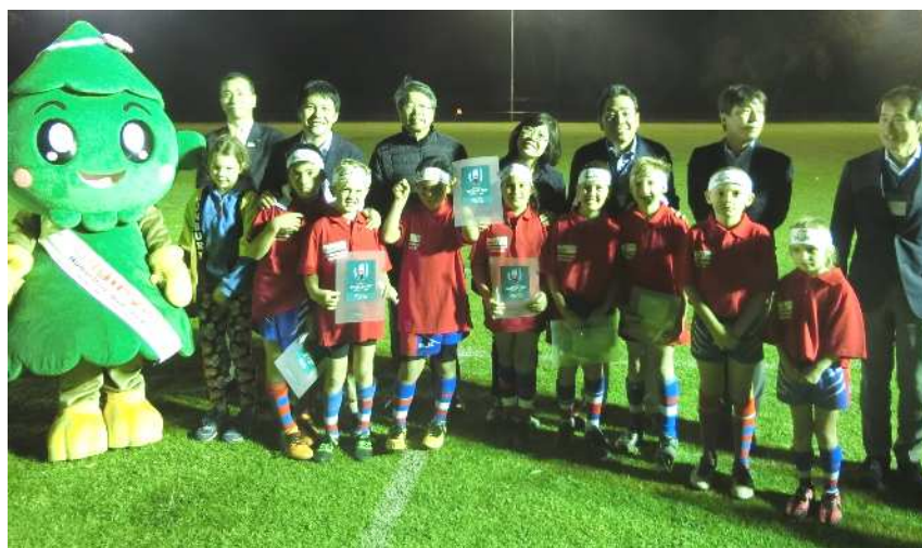
子どもたちとともにグラウンドにて