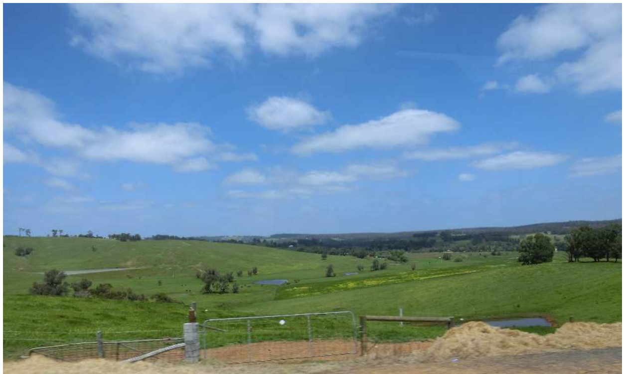
バンバリーの美しい景色

観光面では、海水浴のできるビーチがあり、マリンスポーツが盛んである。またクームバナ湾のイルカは人なつっこく、観光の大きな柱となっており、ドルフィンディスカバリーセンターには世界中から観光客が訪れている。