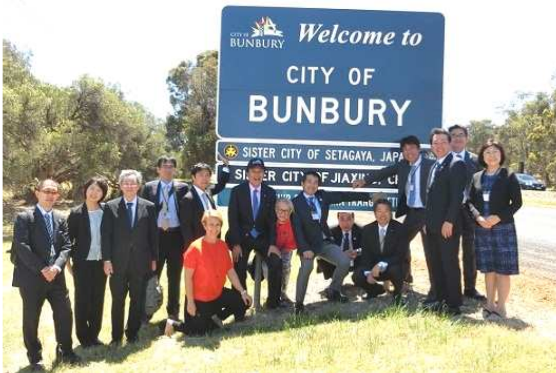
バンバリー市の入口で区長、議長らとともに

【スポーツ交流】 ドラゴンボート大会参加 バンバリーマラソン大会参加 バンバリー市中中学生バスケットボールチーム来訪 世田谷 2 4 6 ハーフマラソン参加