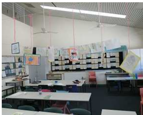
生徒同士がコミュニケーション をとりやすい座席配置の教室

生徒たちは、勉強している日本語で一生懸命案内してくれました。遠く離れたオーストラリアでこれだけ多くの子どもたちが日本語を学んでいることを嬉しく思うとともに、生徒たちの能力の高さを実感しました。