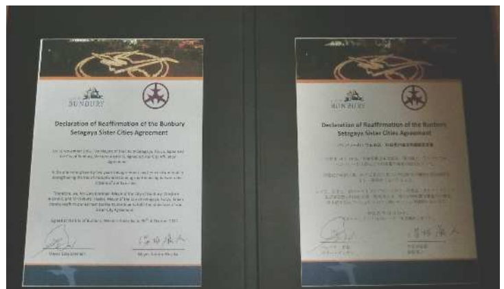
姉妹都市提携再確認書