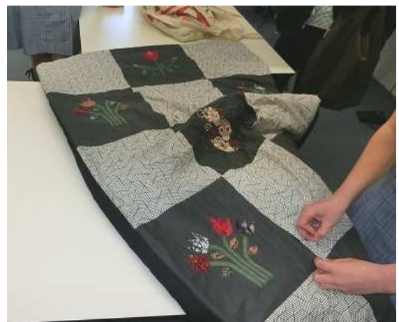
作成中のブランケット

中学生からは、第2外国語としてフランス語との選択制で日本語を学ぶそうで、訪問当日も、和風の小物が満載の日本語教室では、多くの生徒が日本語を勉強していました。私たちを案内してくれた中学3年生の女子生徒は、国際食文化としてラーメンをスープづくりから挑戦しているとのことで、クリスマスに向けて、ジブリをテーマにし