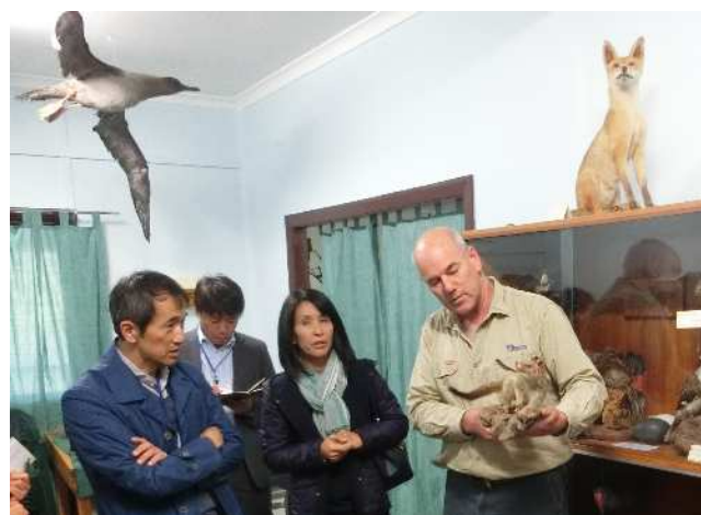
昼間は姿を現さない動物は 剥製で展示されています