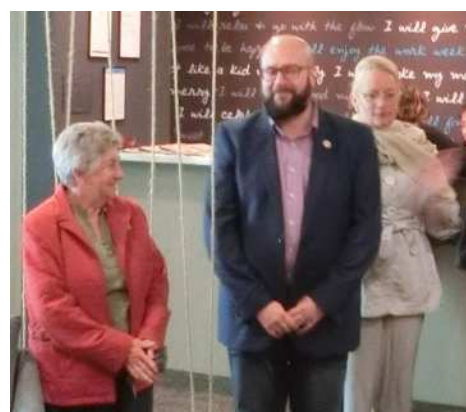
国際交流委員の方々

ホテルの部屋に荷物を運び入れた私たちは、早速、最初の交流プログラムである日本映画祭の会場に向かいました。