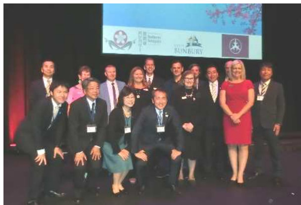
市議の皆さんとともに