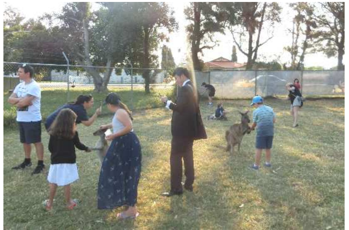
子どもたちとともに

に暮らす動物たちについて学ぶため、必ず見学を訪れる施設だそうです。特色は何といても、動物たちと触れ合えることでした。カンガルーに餌をあげながら、触れ合うことができたことには驚きでした。一緒に散歩した地元の子どもたちも大喜びでした。