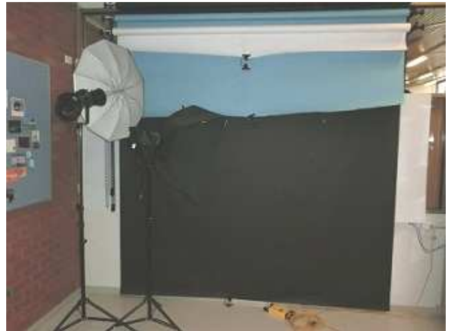
教室内のフォトスタジオ

学校の敷地は、以前は農場だったそうで、ユーカリやマリーの木などの美しい自然に囲まれており、自然を生かしたパーマカルチャーのコミュニティガーデンが生徒たちの手によって運営されていました。