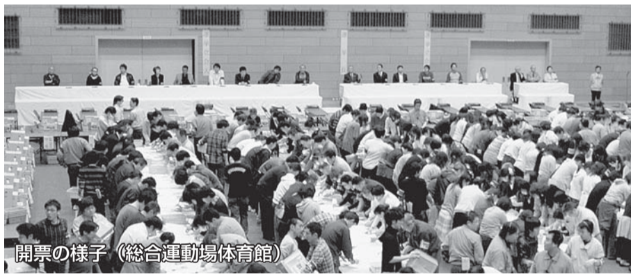
開票の様子 (総合運動場体育館)

区議会ホームページ http://www.city.setagaya.tokyo.jp/kugikai/ または、区のホームページの「世田谷区議会」からアクセスしてください。